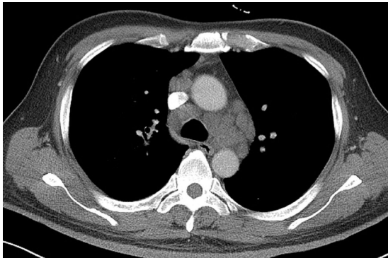
그림 1. 흉부 CT 소견