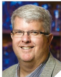
테드 로스 Ted Ross